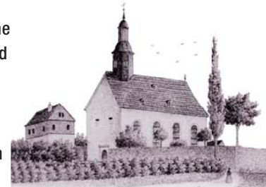
Pfarrkirche in Fischbach, erbaut 1781 Zeichnung von Joseph Albert, 1854

Das Bild zeigt die Aufnahme Mariens in den Himmel und ihren Empfang durch die Heilige Dreifaltigkeit aus Gott-Vater, Gott-Sohn und Heiligem Geist. Die „armen Seelen“, die sich zu deren Füßen im Fegefeuer winden, sind wohl erst 1901 hinzugefügt worden.