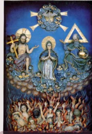
Gimbacher Wallfahrtsbild, 1717 Aufnahme Mariens in den Himmel durch die Hl. Dreifaltigkeit

1287 wurde der Vorgängerbau der Wallfahrtskapelle erstmals urkundlich erwähnt. Sie war Johannes dem Täufer geweiht und schon früh das Ziel von Pilgern: Der Legende nach hatte der Gimbacher Schäfer einen Baumstamm mit dem Bild der Dreifaltigkeit in einem Sturzbach treiben sehen. Er zog es an Land und stellte es in der Gimbacher Johanneskapelle auf. 1335 genehmigte der Vatikan die Verehrung des Bildes.