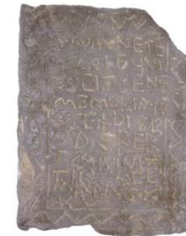
Roteldis-Grabstein 7. Jahrhundert

Historisch sogar noch bedeutender als das Dreifaltigkeitsbild ist der Roteldis-Stein , der ebenfalls in der Seitenkapelle zu sehen ist. Der Grabstein aus dem 7. Jahrhundert – auch auf dem Gimbacher Hof entdeckt – ist Zeugnis für die ersten Christen im Taunus. Außerdem lohnt sich ein Blick auf ein Glasfenster des Hl. Antonius des Einsiedlers (entstanden vor 1400) und das große Dreifaltigkeitsrelief, das aus der Kapuzinerkirche in Frankfurt stammt.